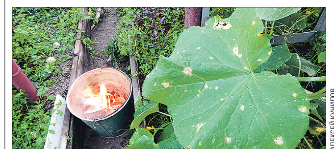
Разжигание костра — не самый эффективный способ дезинфекции теплицы