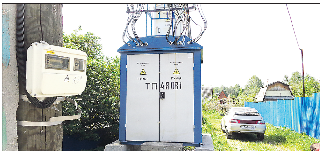
СНТ вынуждены за свой счёт модернизировать систему электроснабжения, а теперь их лишают дешёвого тарифа