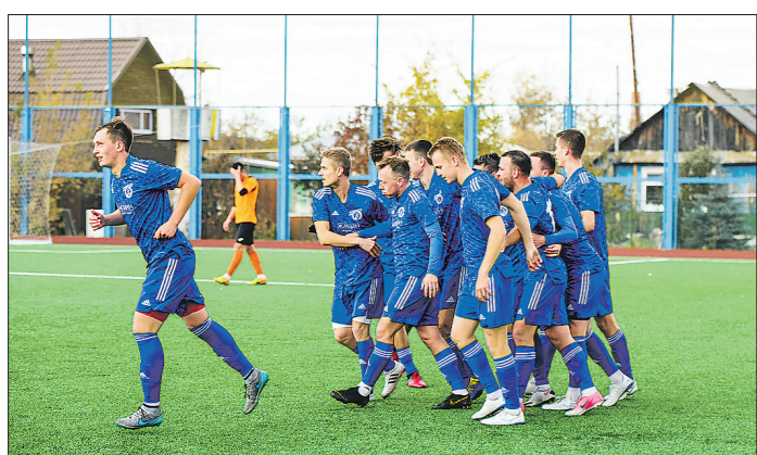
Михайловцы за 22 матча забил 86 мячей