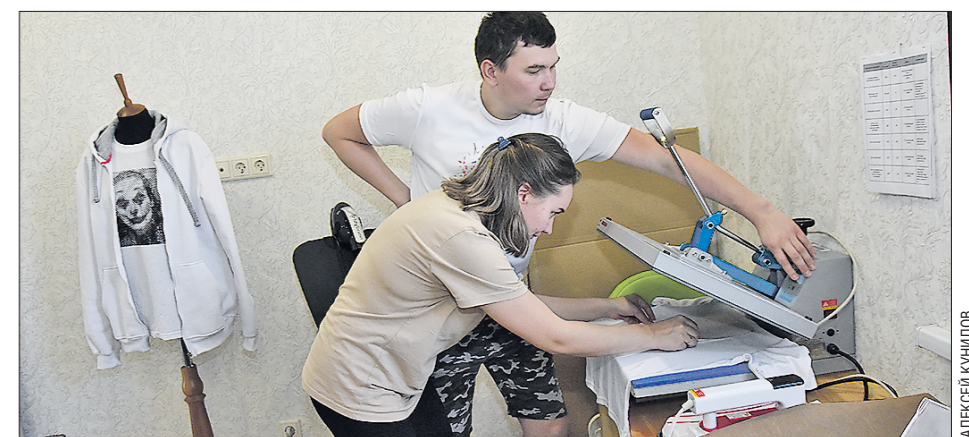
Одно из комнат в своём доме Деревягини обустроили под офис, где создают свои изделия