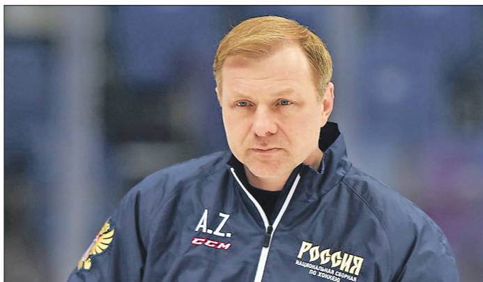
Алексей Жамнов уже определился со своим новым тренерским штабом

Алексей Юрьевич – прекрасный в прошлом игрок, олимпийский чемпион, но практически никогда не работал главным тренером. После завершения спортивной карьеры он занимался менеджерскими делами, а затем был приглашён в тренерский штаб сборной России. Но ещё раз: опыта работы главным тренером у