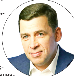
ДЕПАРТАМЕНТ ИНФОРМАТИКИ СО