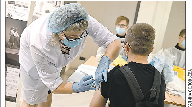
Обязательную вакцинацию распространяют всё на большее количество сфер