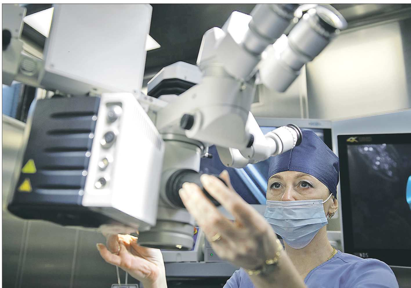
Помещение отремонтировали и разместили в нём уникальное медоборудование отечественного и зарубежного производства – эндоскопические стойки и ультразвуковые диссекторы, которые позволяют рассекать ткани и тут же прижигать сосуды