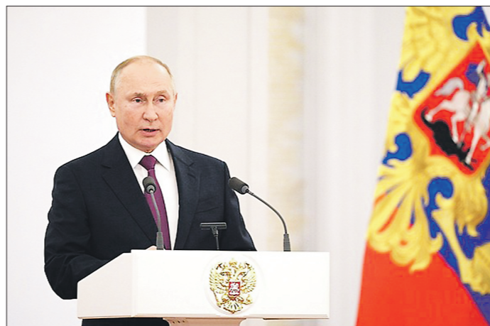
Владимир Путин поблагодарил россиян за активное участие в выборах и за доверие, оказанное кандидатам в депутаты

При этом он добавил, что наличие в составе Госдумы депутатов, которые работают не первый созыв, обозначает преемственность тра-