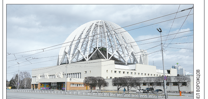
Екатеринбургский цирк закроют на капремонт в 2022 году

В Екатеринбурге определили подрядчика, который займётся реконструкцией здания цирка. Тендер выиграла московская компания. В то же время Федеральная антимонопольная служба (ФАС) нашла нарушения закона о контрактной системе в закупке.