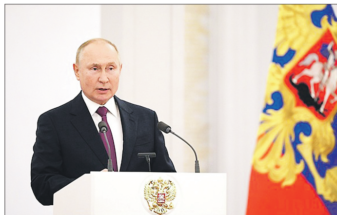
Владимир Путин поблагодарил россиян за активное участие в выборах и за доверие, оказанное кандидатам в депутаты

При этом он добавил, что наличие в составе Госдумы депутатов, которые работают не первый созыв, обозначает преемственность тра-