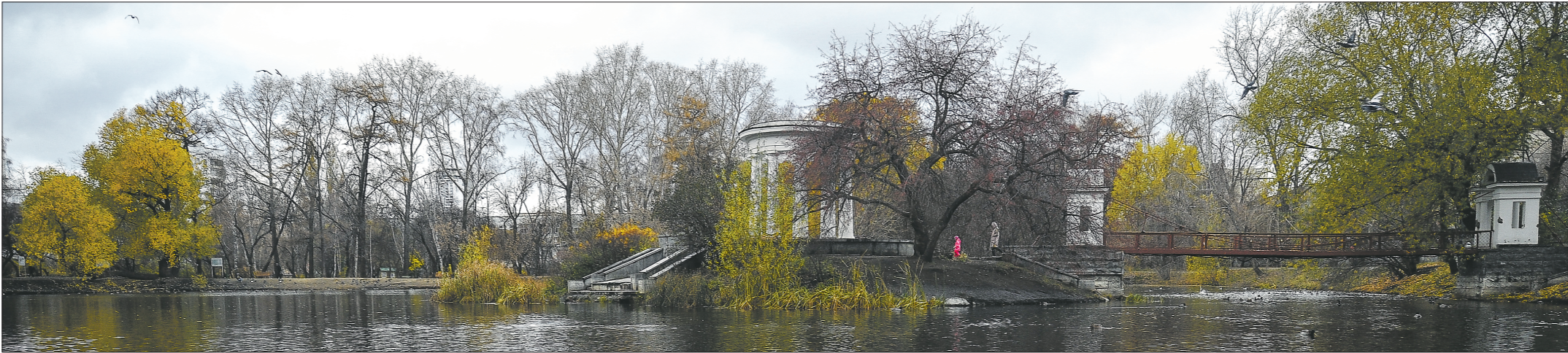
Харитоновский парк выполнен в традиционном английском стиле и относится к числу так называемых «пейзажных парков», основанных на принципе использования естественных ландшафтов и подчёркивания природной красоты.