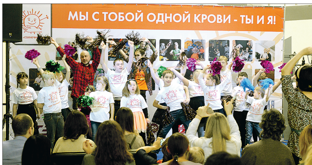
Некоторые особенные дети вполне удачно вписываются в детские коллективы, но всё же это зависит не только от желания ребёнка, но и от степени нарушений его здоровья

На Среднем Урале утвердили порядок получения общего образования лицами с умственной отсталостью (интеллектуальными нарушениями) в общеобразовательных школах региона.