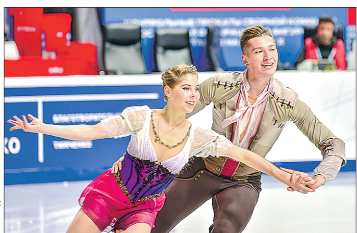
Анастасия Мишина и Александр Галлямов одержали победу в первом для себя международном турнире сезона

В Йошкар-Оле стартовал второй этап Кубка России по фигурному катанию. Попробовать свои силы на марийском льду приехали звёзды этого вида спорта – танцоры Виктория Синицина и Никита Кацалапов, Анастасия Скопцова и Кирилл Алёшин, одиночник Александр Самарин и другие.