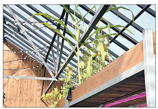
Стебли кукурузы на втором ярусе уже доросли до крыши, и на них взорвутся початки