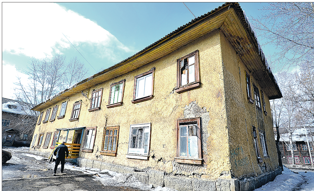
В основном в программу КРТ попадут дома высотой не более трёх этажей