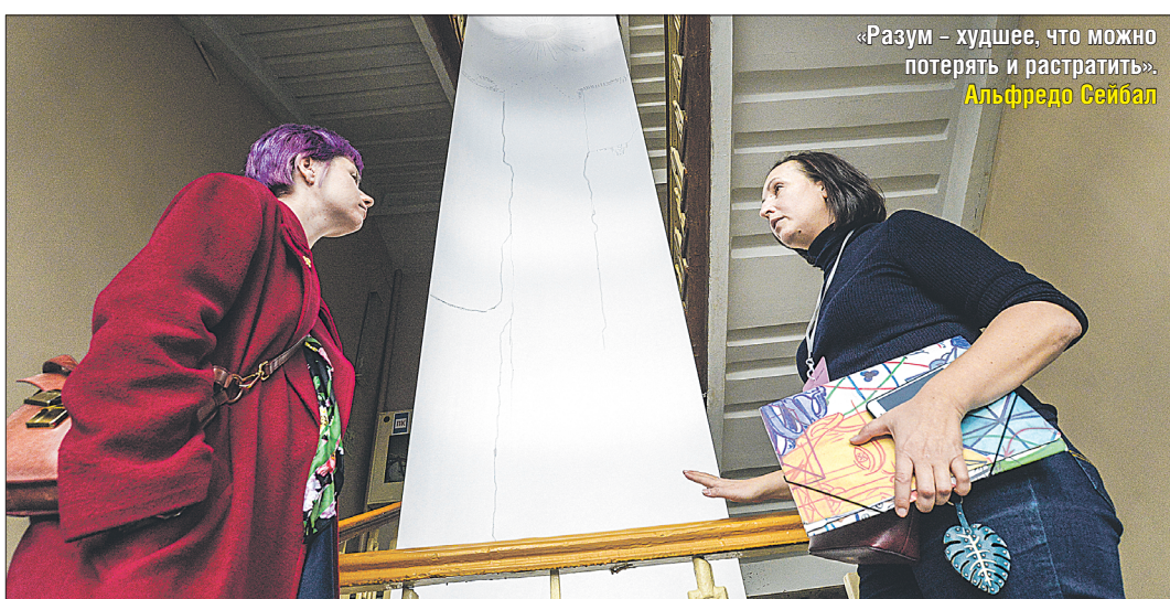
«Разум – худшее, что можно потерять и прастратить». Альфредо Сейбала