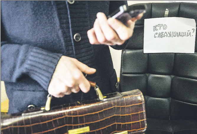
За сменой глав уральских муниципалитетов «ОГ» следит регулярно

В Заречном конкурсе по отбору кандидатур на должность главы города объявили 30 сентября — на первом очередном заседании думы в новом составе. Тогда же была сформирована муниципальная часть конкурсной комиссии. О начале приёма документов от кандидатов объявят, как только станут известны фамилии членов комиссии от области. Окончательное решение должно быть принято до конца декабря.