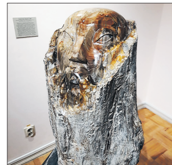
«Бурхан» – почитаемый дух в Бурятии, на родине Сергея Фалькина