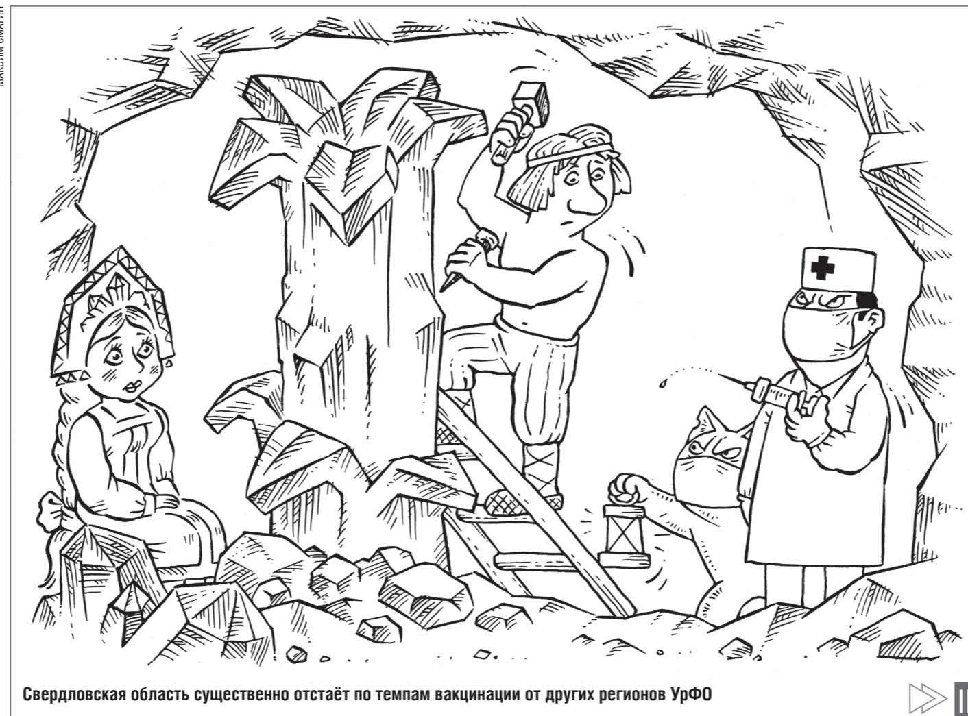
Свердловская область существенно отстает по темпам вакцинации от других регионов УрФО

На Среднем Урале вводится обязательная вакцинация граждан