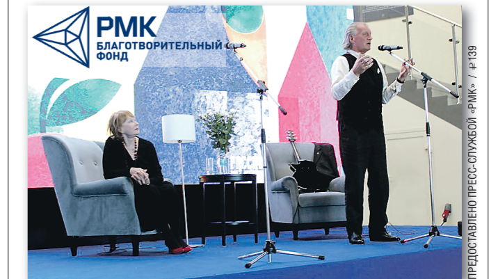
Специально ко Дню учителя актёры театра и кино Лариса Удовиченко и Сергей Колесников сыграли спектакль для преподавателей.

Подготовлено в соответствии с критериями, утверждёнными приказом Департамента информационной политики Свердловской области от 09.01.2018 №1 «Об утверждении критериев отнесения информационных материалов, публикуемых государственными учреждениями Свердловской области, в отношении которых функции и полномочия учредителя осуществляет Департамент информационной политики Свердловской области, к социально значимой информации».