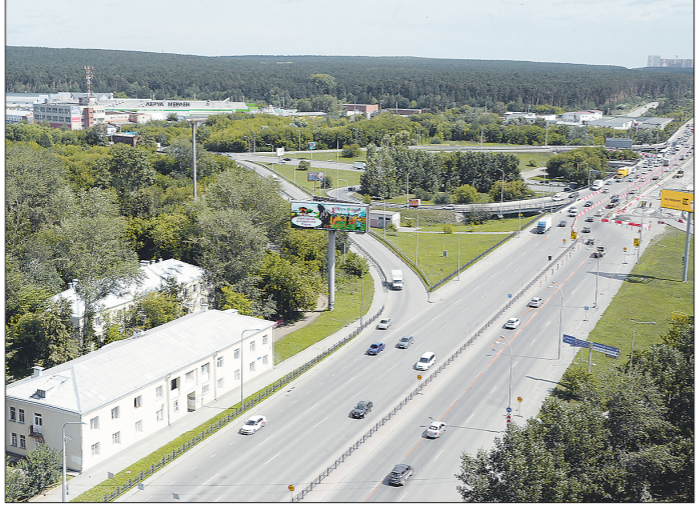
Дорожные работы идут с опережением графика: на 90 процентах строящихся и ремонтируемых дорог уже уложен верхний слой нового асфальта

нашей области с опережением графика, и к концу сентября на 90 процентах строящихся и ремонтируемых по нацпроекту региональных дорогах уже уложен верхний слой нового асфальтобетонного покрытия. Такого показателя, по его словам, удалось достичь благодаря беспрецедентно большому объёму финансирования работ — ведь в этом году на ремонт и строительство дорог в Свердловской области направлено почти 10 миллиардов рублей. Значительная часть этой суммы — 7,3 миллиарда — составили средства федерального бюджета, из которых к тому же 4,3 миллиарда были выделены нашему региону сверх первоначально запланированной на год суммы. В том числе с учётом необходимости подготовки к Универсиаде-2023 и к празднованию 300-летия Екатеринбурга и Нижнего Тагила.