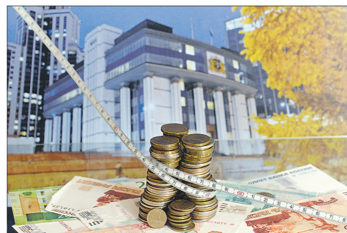
Заксобранье области приступит к работе над бюджетом-2022 после 8 октября

Подготовлено в соответствии с критериями, утверждёнными приказом Департамента информационной политики Свердловской области от 09.01.2018 №1 «Об утверждении критериев отнесения информационных материалов, публикуемых государственными учреждениями Свердловской области, в отношении которых функции и полномочия учредителя осуществляет Департамент информационной политики Свердловской области, к социально значимой информации».