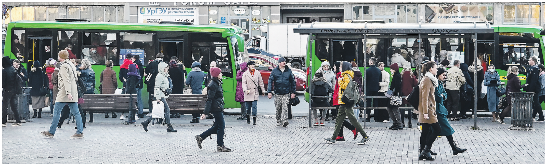
По данным Роспотребнадзора, среди заболевших коронавирусом 61,1 процента активно посещают общественные места и пользуются общественным транспортом. Может, и в автобусах пора вводить QR-код?

Сегодня на Среднем Урале вступает в силу постановление управления Федеральной службы по надзору в сфере прав потребителей и благополучия человека по Свердловской области №5-24/1 от 1.10.2021 об обязательной вакцинации против COVID-19 работников отдельных отраслей.