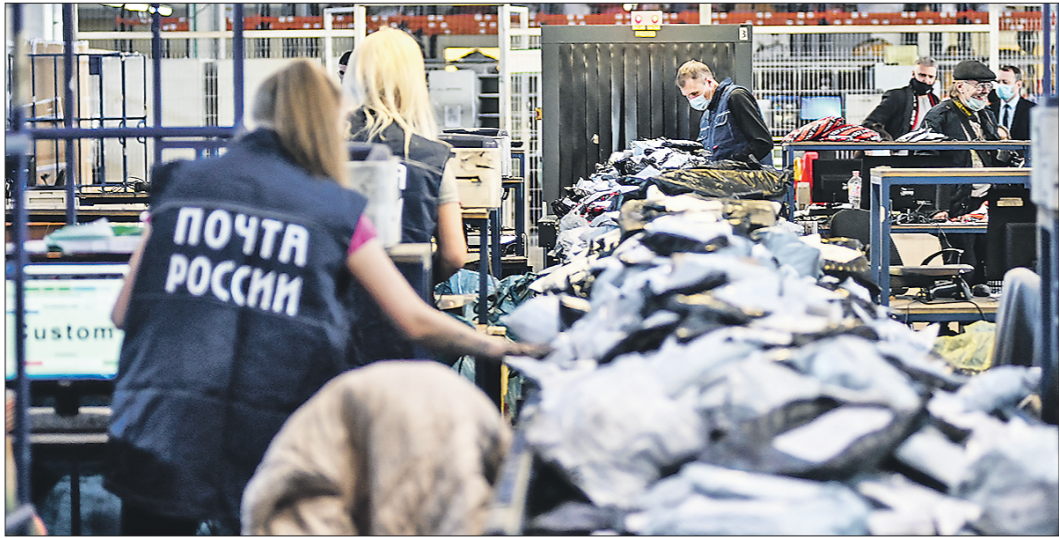
Высота почты на конвейерных лентах достигает одного метра. Таможенникам приходится разгребать эти кучи и пропускать через рентген каждое МПО, чтобы не допустить ввоза в Россию запрещённых товаров