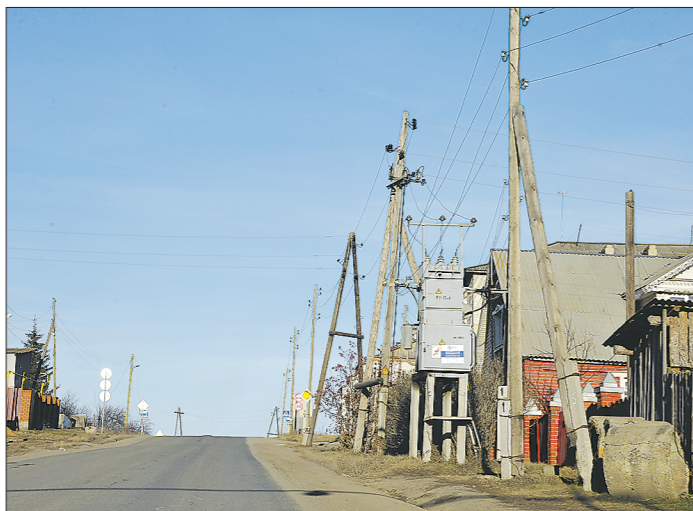
Электросетевое хозяйство в Ивдельском ГО нуждается в серьёзной реконструкции, признают чиновники