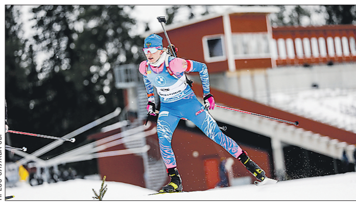
Контрольные тренировки женской команды состоятся в Тюмени, мужской – в Ханты-Мансийске

Подготовлено в соответствии с критериями, утверждёнными приказом Департамента информационной политики Свердловской области от 09.01.2018 №1 «Об утверждении критериев отнесения информационных материалов, публикуемых государственными учреждениями Свердловской области, в отношении которых функции и полномочия учредителя осуществляет Департамент информационной политики Свердловской области, к социально значимой информации».