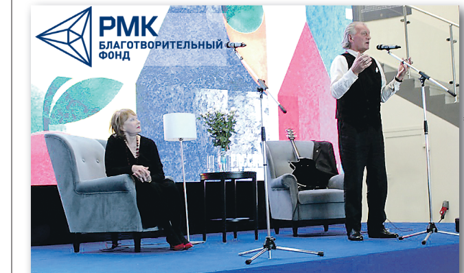
Специально ко Дню учителя актёры театра и кино Лариса Удовиченко и Сергей Колесников сыграли спектакль для преподавателей.

Подготовлено в соответствии с критериями, утверждёнными приказом Департамента информационной политики Свердловской области от 09.01.2018 №1 «Об утверждении критериев отнесения информационных материалов, публикуемых государственными учреждениями Свердловской области, в отношении которых функции и полномочия учредителя осуществляет Департамент информационной политики Свердловской области, к социально значимой информации».