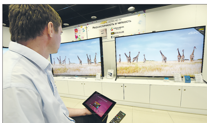
Контент телеканалов раньше мог отличаться в телеэкранной и онлайн-версиях. Сейчас отличий между ними не будет

По словам председателя Госдумы Вячеслава Володина , десятки тысяч россиян наблюдаются в частных кли-