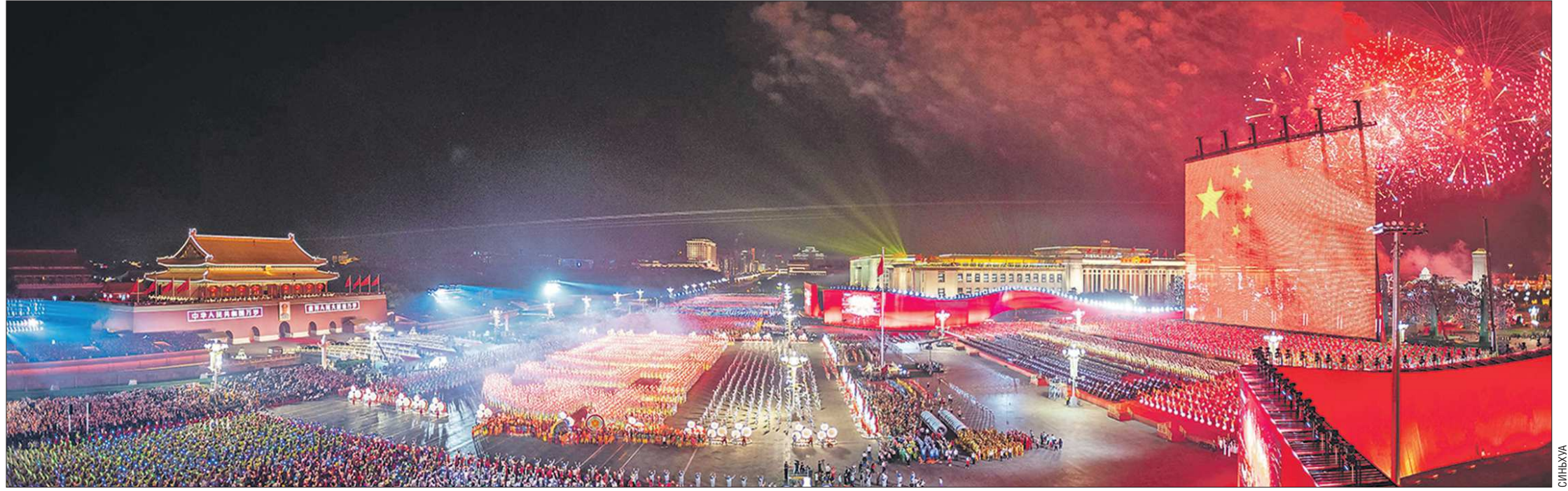
Масштабные торжества по случаю Дня образования КНР ежегодно собирают на площади Тяньаньмэнь в центре Пекина сотни тысяч человек