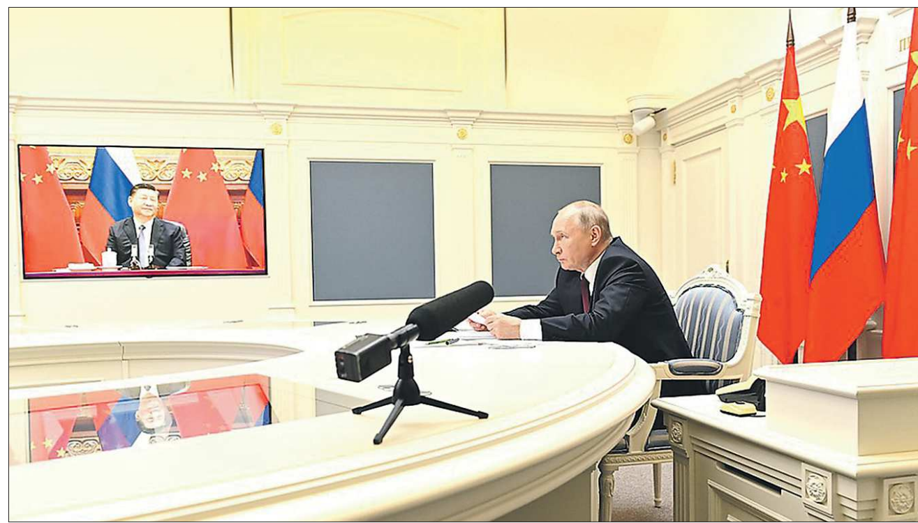
Перед продлением российско-китайского договора о добрососедстве, дружбе и сотрудничестве председатель КНР Си Цзиньпин и Президент России Владимир Путин обсудили перспективы взаимодействия двух стран

В современном мире, который уже почти два года живёт в условиях пандемии новой коронавирусной инфекции, Китай не просто справился с её экономическими последстви-