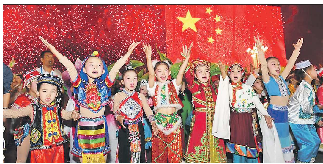
Представители всех народностей, населяющих Китай, отмечают День образования КНР наравне со всеми гражданами Поднебесной

Значительное ускорение торгово-экономическому и финансовому взаимодействию Урала и КНР дало введение в Екатеринбург шесть лет назад Международной промышленной выставки «ИННОПРОМ», на которой Китай впервые выступил страной-партнёром. Позже, в 2016 и 2018 годах, Екатеринбург становился площадкой для организации Российско-Китайского ЭКСПО. И сегодня, несмотря на продолжающийся коронакризис, двусторонние связи продолжают развиваться. Так, в июле между китайским городом Шицзячжуан и Екатеринбургом был запущен грузовой авиамаршрут компании «Уральские авиалинии». По нему в уральскую столицу три раза в неделю доставляют китайские товары, купленные через Интернет, и международные почтовые отправления.