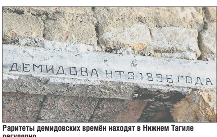
Раритеты демидовских времён находят в Нижнем Тагиле регулярно

В Нижнем Тагиле по проекту «Образование» в этом году начат капитальный ремонт одного из старейших образовательных заведений города - школы №23 имени Юрия Батутина. Здание служит тагильчанам уже 82 года и имеет износ более 70 процентов.