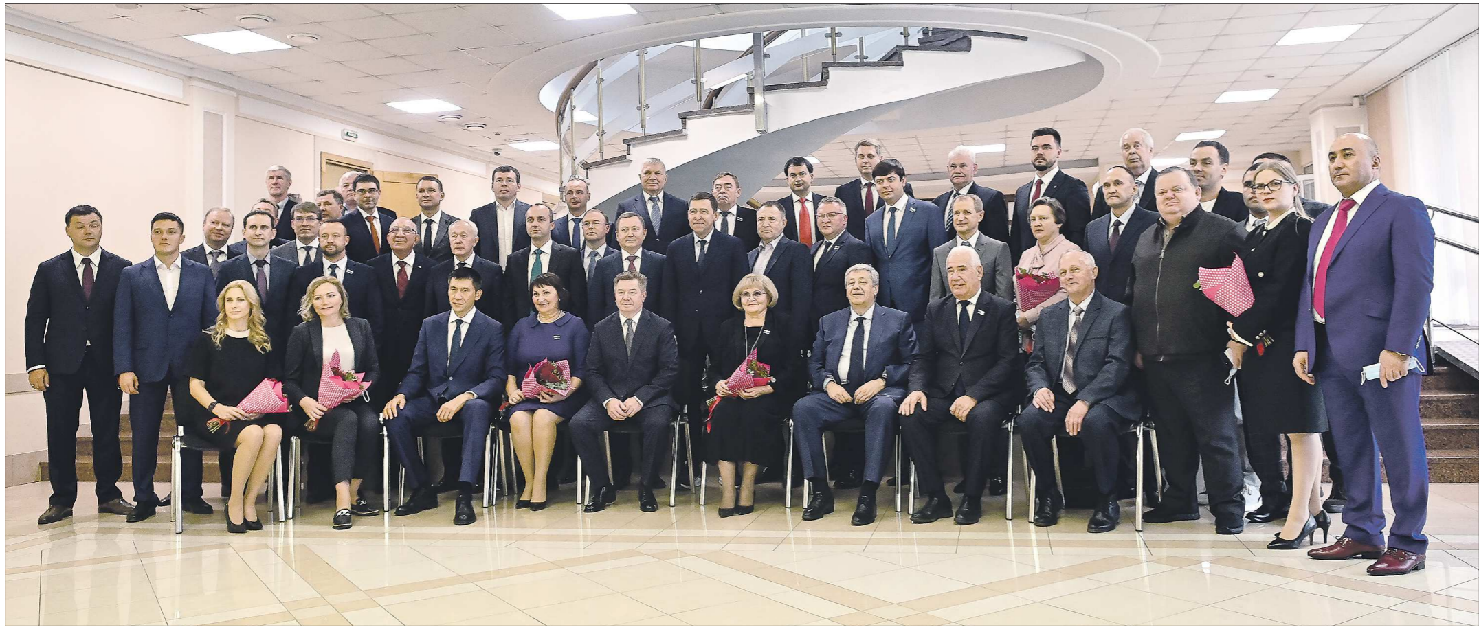
Вчера избранные депутаты Законодательного собрания получили свои мандаты. Рассказываем, кто эти люди и как нынешний созыв областного парламента изменился по сравнению с предыдущим

партий стало пять, количество женщин увеличилось вдвое, а два депутата живут не в Свердловской области