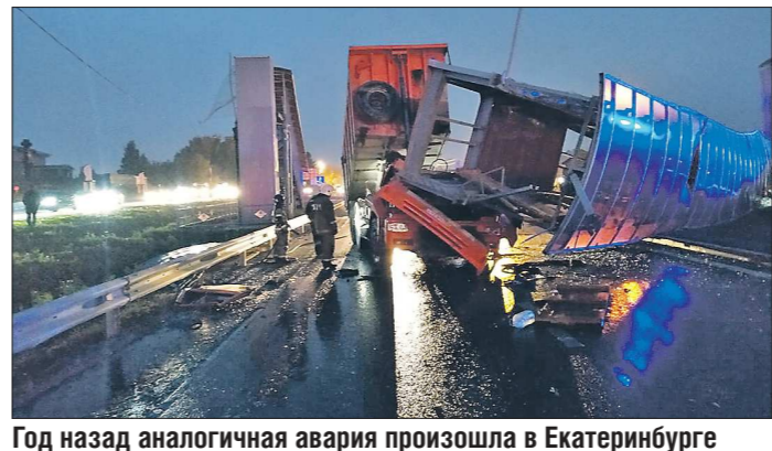
Год назад аналогичная авария произошла в Екатеринбурге

Последний случился вчера утром в Пермском крае на 50-м километре автодороги Пермь – Екатеринбург. Упавшая в результате удара конструкция придавила как виновника трагедии, управлявшего самосвалом «МАН», так и проезжавшего рядом водителя «Газели». А 29 сентября прошлого года в Екатеринбурге КАМАЗ снёс поднятым кузовом надземный пешеходный переход на Челябинском тракте – погиб водитель самосвала. Подобные аварии множатся в связи с массовым строительством лёгких пешеходных переходов над оживлёнными трассами. Понятно, что виноваты водители самосвалов, которые проявляют невнимательность. Но может, что-то не так и с нашими переходами? Согласно ГОСТу их под-