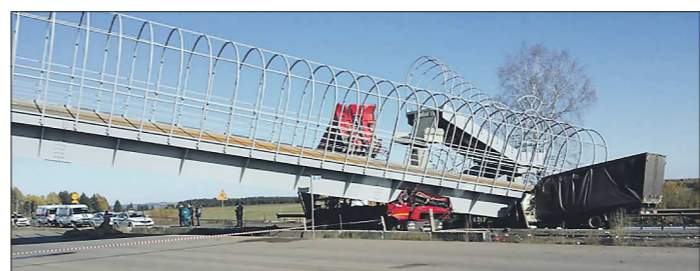
Вчерашнее обрушение перехода парализовало движение по трассе Р-242 Пермь – Екатеринбург, движение временно организовано в объезд

Подготовлено в соответствии с критериями, утверждёнными приказом Департамента информационной политики Свердловской области от 09.01.2018 №1 «Об утверждении критериев отнесения информационных материалов, публикуемых государственными учреждениями Свердловской области, в отношении которых функции и полномочия учредителя осуществляет Департамент информационной политики Свердловской области, к социально значимой информации».