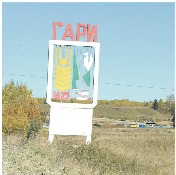
Вездный знак в Гари. Расстояние от Екатеринбурга - 480 км, а до Андрюшино, где находится лагерь геофизиков, ещё 54 км