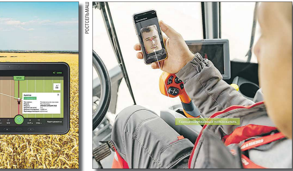
PCM Фейс АЙДи

Таким образом PCM Роутер увеличивает производительность агромашин на 15–30 процентов и помогает убирать урожай в срок и без потерь. Эти данные специалисты Ростсельмаш получили в ходе тестирования системы в хозяйстве компании «Русагро» в Белгородской области. Испытания показали, что программа автоматически выстраивала