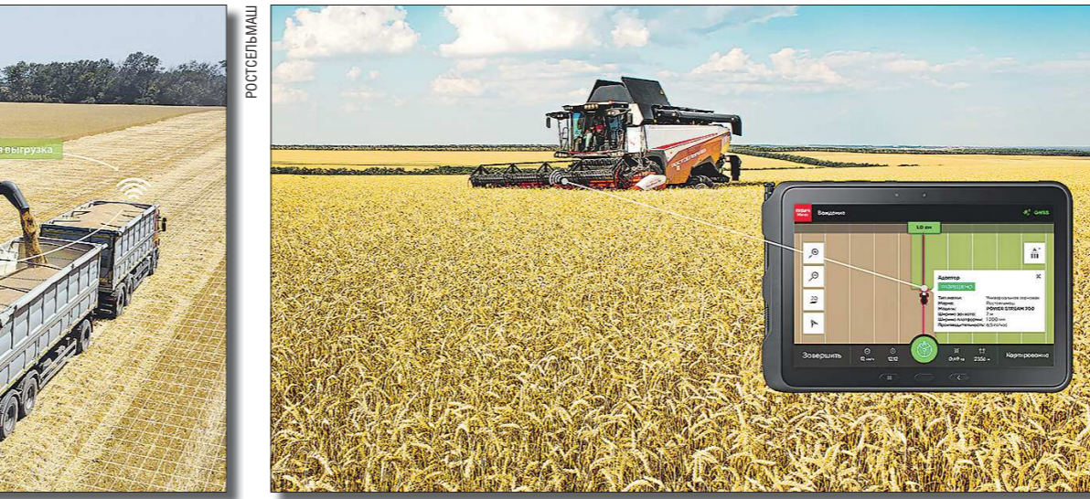
PCM Умная метка

Базовая станция RTK обеспечивает высокую достоверность позиционирования — до 2,5 сантиметра, а постоянно поступающие по радиоканалам сигналы вносятся в траекторию агромашины поправки, чтобы она не сбивалась с заданного пути. Такой метод спутниковой навигации обеспечивает точность прохода даже в рассредоточенных полях с большим перепадом высот. Одна станция RTK с радиусом покрытия 5–7 километров позволяет передавать необходимые поправки на большую группу техники — это способствует плавной уборке урожая или севу семян в любой сезон.