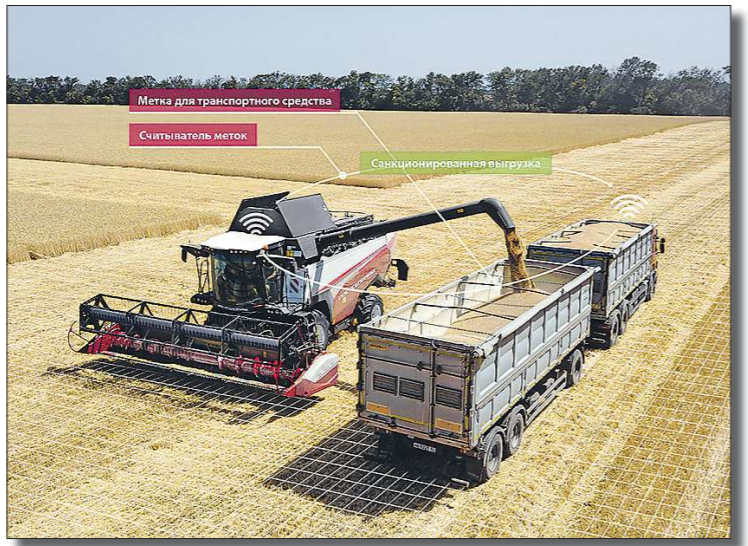
PCM Транспорт АЙДи

Доступные уже сейчас новинки позволяют превратить обычную сельхозтехнику в роботизированный комплекс, на борту которого есть системы спутниковой навигации, картографирования урожайности, идентификации механизатора и масса иных полезных дивайсов. Прежде чем эти решения были внедрены в производство, они прошли длительные испытания.