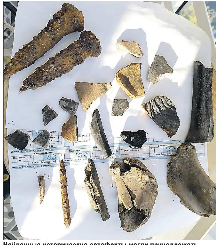
Найденные исторические артефакты могли принадлежать людям, жившим в этих местах в момент основания Екатеринбурга

Среди них могут быть предметы, которыми пользовались люди в момент основания города. Расскажите подробнее про сами находки. Это фрагменты посуды, множество изделий из металла, есть зубила, шпильки. Есть, например, железные бляшки, более-менее целые. Керамика целиком, конечно, крайне редко сохраняется. Но это небольшой шурф. От него полноценных коллекций ожидать и не нужно.