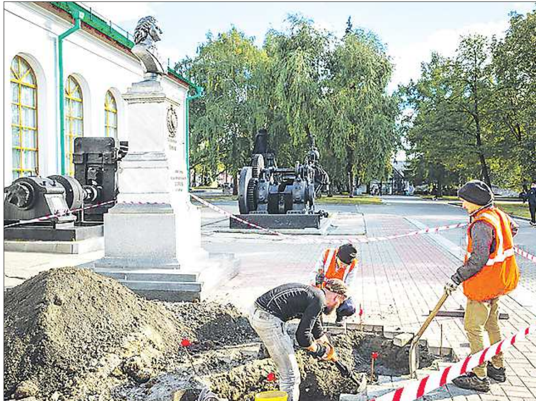
Бюст Екатерины I планируют разместить в Историческом сквере, рядом с экспозицией крупногабаритной техники Музея архитектуры и дизайна УрГАХУ и Петром I

В Историческом сквере, в центре Екатеринбурга, рядом с Музеем архитектуры и дизайна УрГАХУ, к 300-летию со дня основания города планируют установить бюст императрицы Екатерины I. На месте предполагаемого размещения по всем правилам необходимые археологические исследования. Их провели. И на глубине 2,4 метра от брусчатки было обнаружено множество находок. Вполне возможно, что они относятся к периоду начала строительства Екатеринбурга.