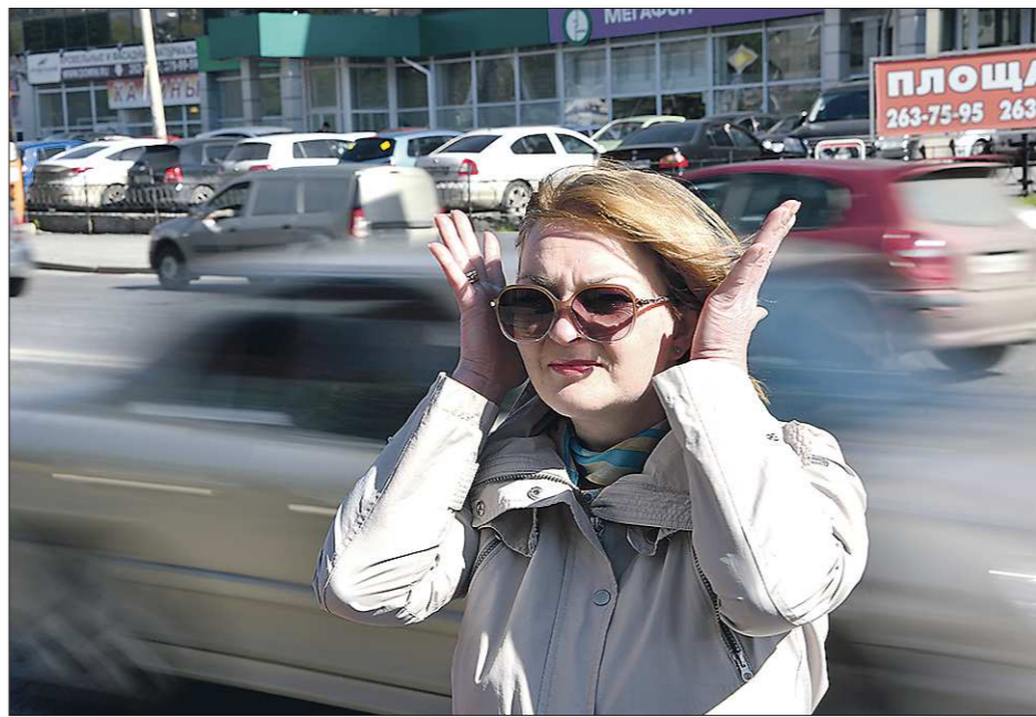
От грохота музыки из авто у прохожих закладывает уши

В преамбуле к пакету законодательных инициатив мэра Москвы говорится о шуме по ночам. Однако в предложенных им поправках временные рамки в основном отсутствуют. Это и правильно: бьющий по ушам и мозгам рёв музыки и дви-