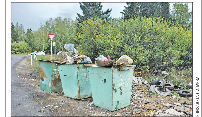
Мусорные контейнеры в деревне Марамзинка есть, но далеко от жилых домов

Видеоматериалы, подготовленные в соответствии с критериями, утвержденными приказом Департамента информационной политики Свердловской области от 09.01.2018 №1 «Об утверждении критериев отнесения информационных материалов, публикуемых государственными учреждениями Свердловской области, в отношении которых функции и полномочия учредителя осуществляет Департамент информационной политики Свердловской области, к социально значимой информации».