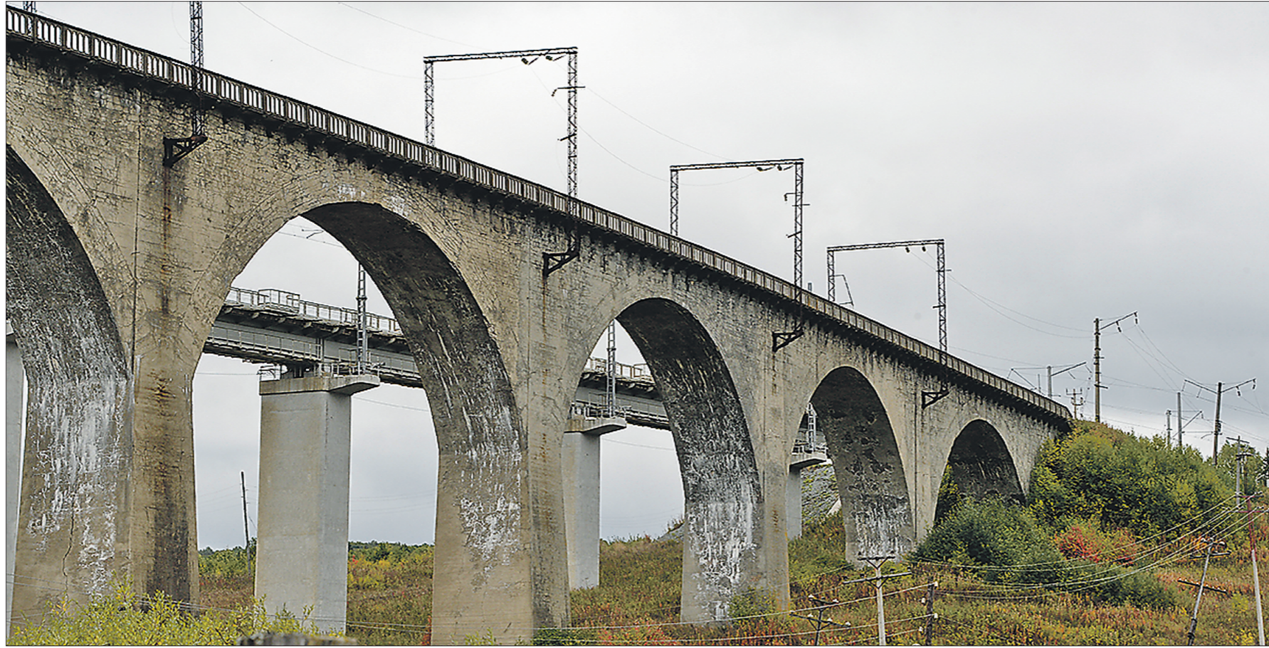
Вот так выглядят виадук между посёлками Пудлинговский и Сарана. Он начал строиться в 1915 году