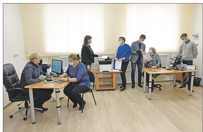
Специалисты Госюрбюро готовятся к приёму посетителей с 1 октября по новому адресу

Подготовлено в соответствии с критериями, утвержденными приказом Департамента информационной политики Свердловской области от 09.01.2018 №1 «Об утверждении критериев отнесения информационных материалов, публикуемых государственными учреждениями Свердловской области, в отношении которых функции и полномочия учредителя осуществляет Департамент информационной политики Свердловской области, к социально значимой информации».