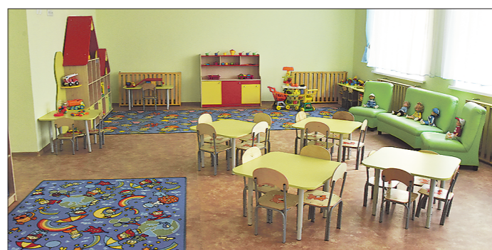
В сентябре на карантин закрыли несколько детских садов

Подготовлено в соответствии с критериями, утвержденными приказом Департамента информационной политики Свердловской области от 09.01.2018 №1 «Об утверждении критериев отнесения информационных материалов, публикуемых государственными учреждениями Свердловской области, в отношении которых функции и полномочия учредителя осуществляет Департамент информационной политики Свердловской области, к социально значимой информации».