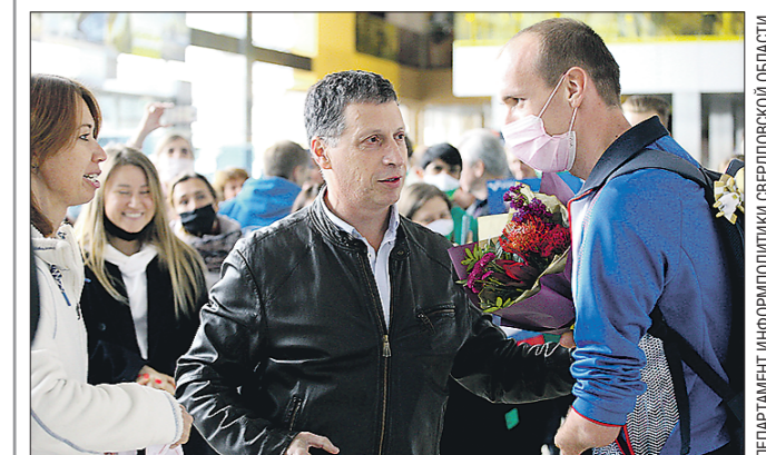
В Екатеринбург прибыл двукратный паралимпийский чемпион Михаил Астахов. В аэропорту Кольцово Михаила встречали друзья, тренеры и поклонники, а также министр физической культуры и спорта Свердловской области Леонид Рапопорт (на фото слева). Михаил Астахов признался, что ему приятно такое внимание. Журналистам он рассказал, что вскоре начнёт готовиться к следующему Паралимпиаде. Напомним, велогонщик в Токио завоевал две золотые медали

Подготовлено в соответствии с критериями, утвержденными приказом Департамента информационной политики Свердловской области от 09.01.2018 №1.