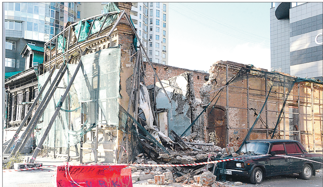
Картина разрушения. По счастливому стечению обстоятельств пострадал лишь автомобиль

В минувшее воскресенье в самом центре Екатеринбурга обрушилась часть стены у архитектурного ансамбля «Усадьба купца Ваганова» по адресу: улица Радищева, 6. Это здание – объект культурного наследия регионального значения, который уже несколько лет находится в плачевном состоянии. И чудо, что при обрушении никто не пострадал.