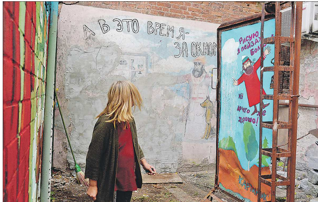
То, что осталось от рисунков почти тридцатилетней давности, самодеятельные реставраторы оставляют в первозданном виде

Это было традиционное выступление художественно-музыкального общества «Картинник», в дальнейшем ещё несколько раз дошло до того же места: встретил их летом в выходные дни, на каких-то фестивалях. Кстати, упомянутые выше разрисованные в жанре лубка досочки, которые Б.У. Кашкин называл «морально-бытовыми», тут же раздаривались им самим и его помощникам – тем зрителям, кто больше всех улыбался. Увы, природная хмурильность лишила меня тогда памятного подарка. А мой товарищ (ныне – солидный профессор и доктор наук) такую досочку получил.