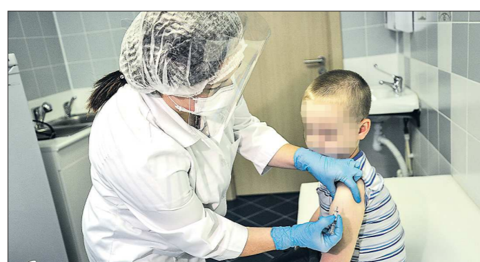
Важно начинать вакцинацию детей против столбняка с первых месяцев жизни

Мальчик, заразившийся столбняком, оказался не вакцинирован от этого заболевания. Как сообщают в пресс-службе Управления федеральной службы по надзору в сфере защиты прав потребителей и благополучия человека по Свердловской области (Роспотребнадзор), родители отказались прививать ребёнка по идеологическим причинам. В итоге небольшие садины на коленках из-за падения с велосипеда и промедление почти на две недели с оказанием экс-