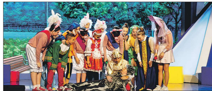
В детском КВН важен не только юмор, но и яркие, творческие номера

Подготовлено в соответствии с критериями, утвержденными приказом Департамента информационной политики Свердловской области от 09.01.2018 №1