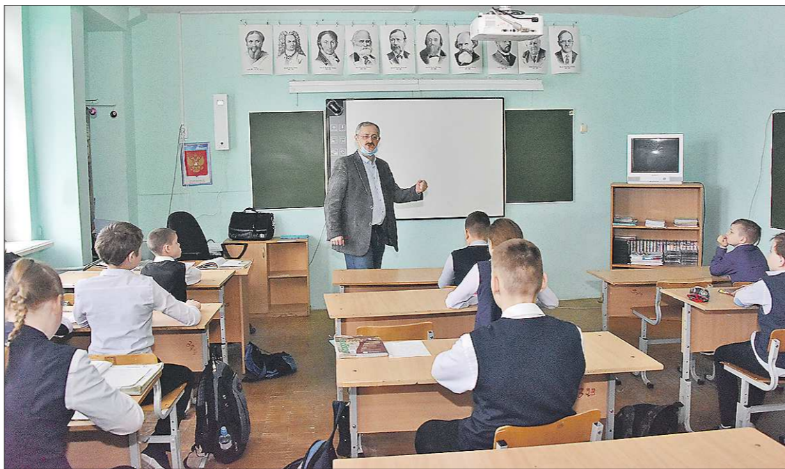
Среди учителей-предметников в свердловских школах в наибольшем дефиците педагоги по русскому языку и литературе

В 2020/2021 учебном году более 125 студентов УрГПУ после третьего курса работали в школах Свердловской области