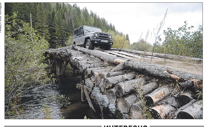
Через такой мост по дороге в деревню «ОГ» ехала на «УАЗике»

— Таксофон поставлен для двух местных жителей — вдруг понадо-