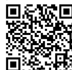
Как проходит замеры ТКО

Нам уже удалось проконтролировать ход зимних и весенних замеров в Екатеринбурге, Нижнем Тагиле, Каменске-Уральском, Ревде и в других городах. В итоге были выявлены грубейшие нарушения, по фактам которых фракция КПРФ в Заксобрании направила в областную прокуратуру депутатский запрос. В ответ надзорный орган подтвердил доводы коммунистов и вынес целый ряд представлений главам муниципалитетов, а также губер-