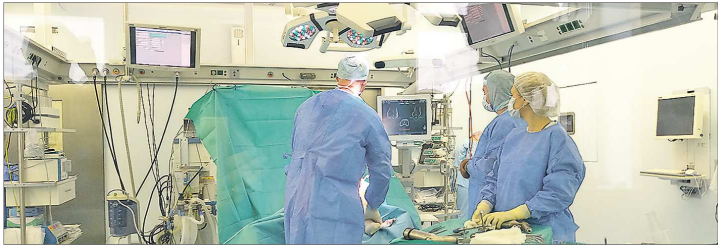
Ранее в госпитале имени Владислава Тетюхина ежегодно проводили более четырех тысяч операций. Сегодня операционные блоки опустели

Публикация предвыборных агитационных материалов зарегистрированных кандидатов в депутаты Государственной Думы Федерального Собрания Российской Федерации восьмого созыва по одномандатным избирательным округам, образованным в Свердловской области, осуществляется безвозмездно в соответствии с частью 2 ст. 66 Федерального закона от 22.02.2014 г. № 20-ФЗ «О выборах депутатов Государственной Думы Федерального Собрания Российской Федерации» по итогам жеребьевки, проведенной 16 августа 2021 г. Материалы предоставлены зарегистрированными кандидатами. Остальные кандидаты в депутаты Государственной Думы Федерального Собрания Российской Федерации восьмого созыва по одномандатным избирательным округам, образованным в Свердловской области, предвыборные агитационные материалы для безвозмездной публикации в «Областной газете» не предоставили.