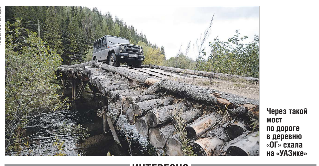
Через такой мост по дороге в деревню «ОГ» ехала на «УАЗике»

Процесс опустошения деревни продолжался несколько лет, вплоть до 2010 года. И с этого