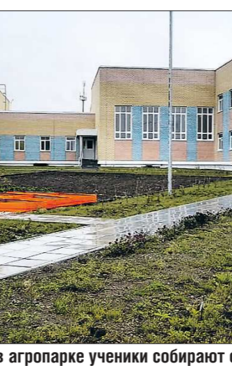
Школа в Сосновке уникальна – в агропарке ученики собирают отличные урожаи овощей

ции до посёлка. Тем не менее разговор жителей с мэром получился довольно острым. Сосновцы пожаловались на плохое состояние внутренних дорог, сокращение рабочих мест, озвучили проблему расширения кладбища. Но более всего на пороге долгой зимы население беспокоит, справятся ли изношенные котельная и теплосети с отоплением жилья. Когда строили школу, один котёл был заменён, но теплоисточник, работающий с 1983 года, требует более серьёзной модернизации. – Чтобы посёлок жил нормально, необходимо срочно заниматься генерацией. Губернатор Свердловской области Евгений Куйвашев , побывав в Сосновке, дал поручение по модернизации котельной. Проектно-сметная документация готова. Если всё пойдёт по плану, по окончании отопительного сезона проведём работы в котельной. Также начнём подготовку к замене сетей, чтобы исключить потери теплоносителя. Как только мы это сделаем, уйдём от множества проблем, – пояснил Андрей Клопов.