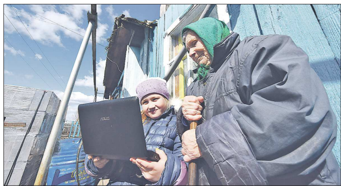
Специалисты обещают, что скорость Интернета будет достаточной для использования телемедицины и организации дистанционного обучения