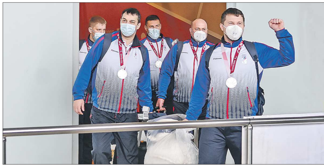
Через десять дней карантина паралимпийцы возвращаются домой