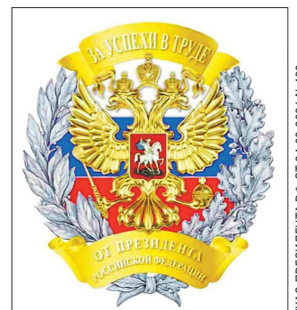
УКАЗ ПРЕЗИДЕНТА РФ ОТ 24.08.2021 №490

Напомним, что 11 октября 2021 года исполнится 85 лет со дня выпуска первого вагона на предприятии.