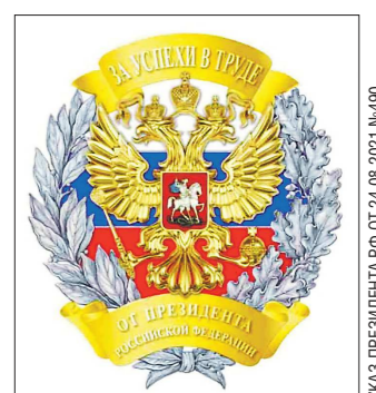
УКАЗ ПРЕЗИДЕНТА РФ ОТ 24.08.2021 №490

Напомним, что 11 октября 2021 года исполнится 85 лет со дня выпуска первого вагона на предприятии.