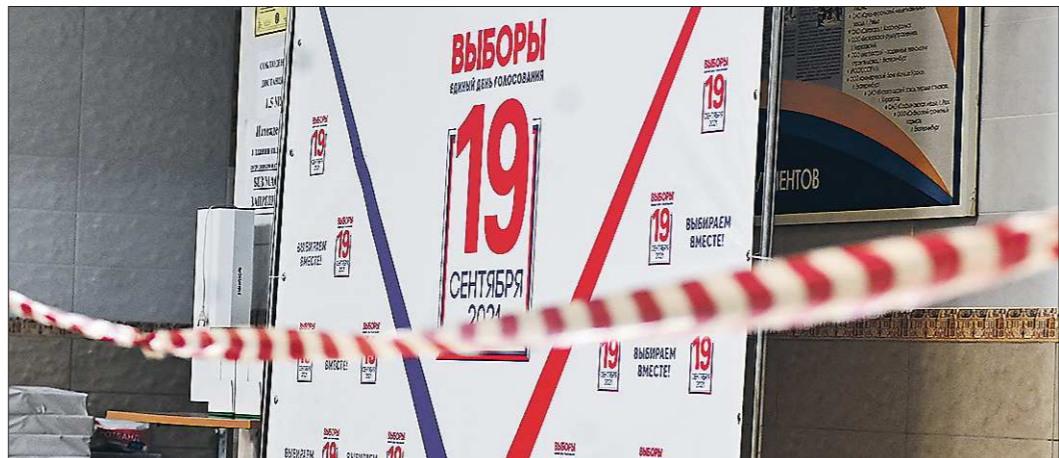
Агитация в СМИ началась 21 августа и завершится 16 сентября