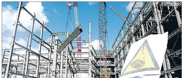
В первом полугодии 2021 года в Свердловской области было заключено около 15 тысяч договоров долевого участия в строительстве