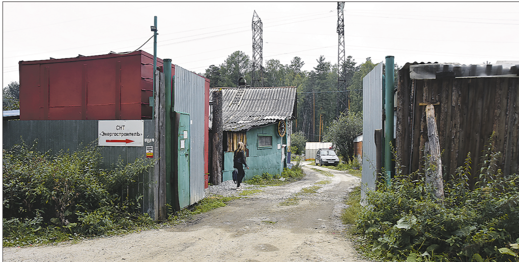
На дороги в некоторых СНТ просто нельзя смотреть без слёз или брани, но всё больше садовых товариществ берутся за их ремонт

– У нас уже имеется опыт решения такой проблемы в Орджоникидзевском районе, – отвечает мэр Екатеринбурга. – Там совместно с областным минприроды провели межведомственную работу и передали его муниципалитету. Тем самым создан прецедент, мы понимаем алгоритм дей-