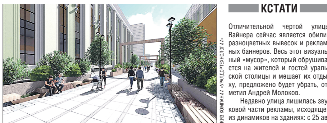
В проекте компании «Уралдортехнологии» прослеживается акцент на озеленение улицы

Изначально приступить к обновлению пешеходной улицы на участке от Малышева до Ленина городские власти планировали ещё в прошлом году, но работы до сих пор не начались.