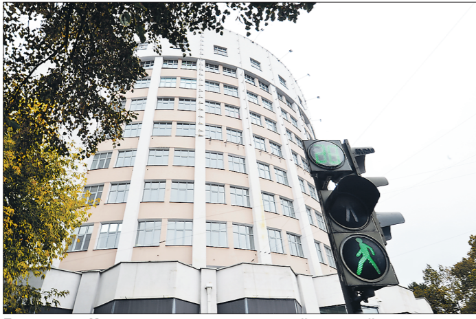
Гостиница «Исеть» пока вызывает самый высокий интерес у потенциальных инвесторов

Власти Свердловской области намерены продолжать восстанавливать объекты культурного наследия за счёт инвесторов. Уже готов перечень из 12 памятников, для сохранения которых планируют заключить концессионные соглашения.