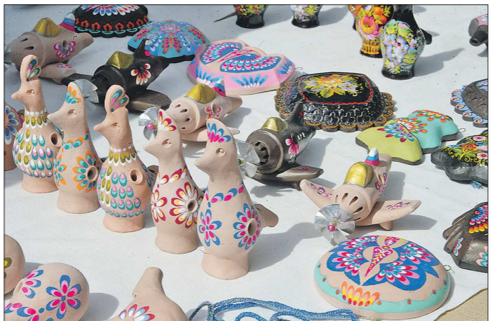
Наряду с традиционными птичками-свистульками мастер наделел способностью издавать свист даже детские самолётики