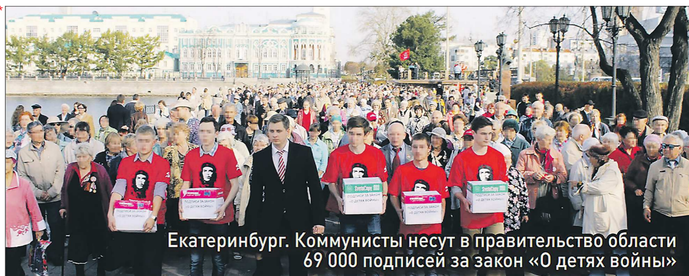
Екатеринбург. Коммунисты несут в правительство области 69 000 подписей за закон «О детях войны»

Ваша фракция КПРФ в Законодательном Собрании Свердловской области.