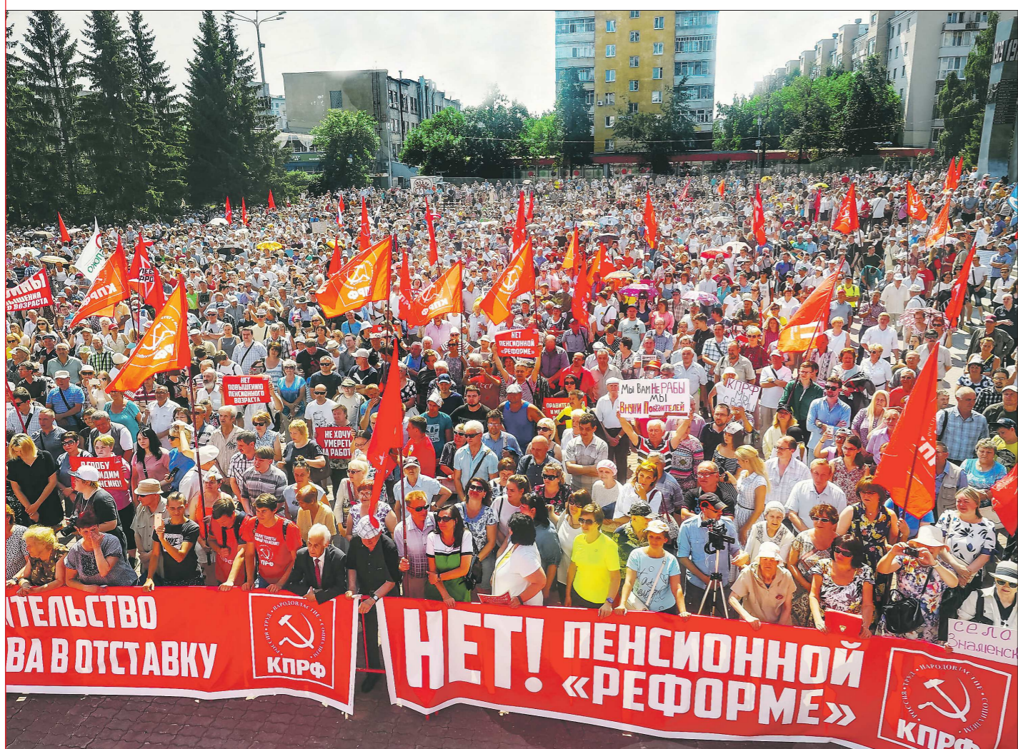
Июль, 2018. Площадь Советской Армии в Екатеринбурге. Митинг ПРОТИВ ПОВЫШЕНИЯ ПЕНСИОННОГО ВОЗРАСТА собрал более 10 000 возмущённых граждан!