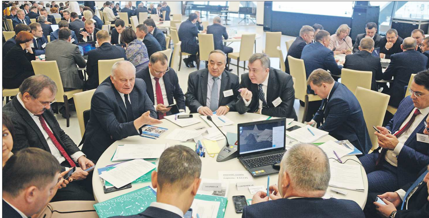
В этом году главы муниципалитетов должны были оплатить членские взносы до 15 апреля, средства поступили в полном объёме