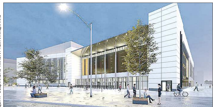
Проект и строительство центра доверили компании «Стройтэк»

Губернатор Свердловской области посетил микрорайон Солнечный в Екатеринбурге, чтобы проверить ход строительства Центра художественной и эстетической гимнастики. После этого глава региона заявил, что руководить новым учреждением будет олимпийская чемпионка и заслуженный мастер спорта Ирина Зильбер.