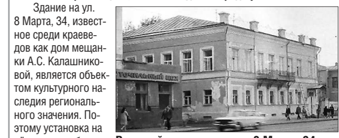
Внешний вид дома по ул. 8 Марта, 34 практически не изменился с тех пор, как там работал Леонид Брежнев

В середине лета в «Областной газете» вышел материал, посвящённый увековечиванию памяти Леонида Ильича Брежнева в столице Среднего Урала, где он работал в 1930 году в доме на улице 8 Марта, 34 (см. заметку «В Екатеринбурге могут восстановить памятную доску Леониду Брежневу» в № 132 от 23.07.2021). Речь в публикации шла о возвращении мемориальной доски генеральному секретарю ЦК КПСС, которая висела на здании в 1982–1999 годах. В управлении государственной охраны объектов культурного наследия Свердловской области рассмотрели это предложение и сообщили, что доска может быть размещена, но с соблюдением ряда условий.