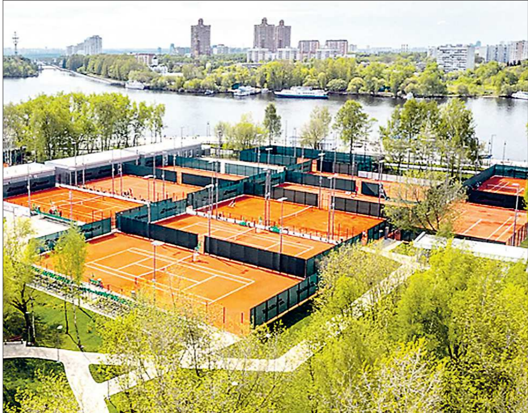
Свердловский теннисный центр

Строительство Уральского теннисного центра под Сысертью было поддержано на федеральном уровне. Объект должен появиться к Универсиаде-2023 и принять соревнования по большому теннису. Премьер-министр РФ Михаил Мишустин подписал распоряжение, согласно которому часть земель лесного фонда Сысертского городского округа были переведены в категорию земель особо охраняемых территорий и объектов для размещения теннисного центра. Соответственно, теперь на этой территории возможно возведение спортивного объекта.