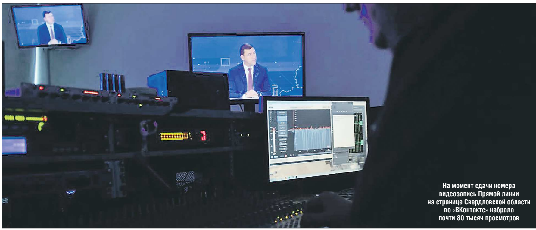
На момент сдачи номера видеозапись Прямой линии на странице Свердловской области во «ВКонтакте» набрала почти 80 тысяч просмотров

В понедельник вечером глава региона Евгений Куйвашев провёл с жителями области Прямую линию – третью в целом и первую на телеканале ОТВ – подобную той, что ежегодно проводит Президент России Владимир Путин. За два с половиной часа губернатор успел ответить на 42 вопроса, 11 из которых оказались анонимными. Практически к каждому вопросу спикер оказывался готов: говорил, что знаком с ситуацией, давал поручения профильным министрам или главам территорий. По всей видимости, во время поездок по муниципалитетам, которых за последнее время было достаточно много, об этих проблемах главе региона уже сообщали.