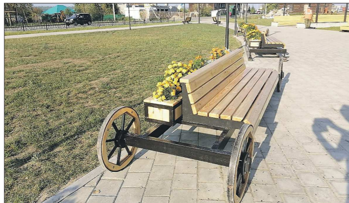
Телеги снова отправляются по Бабиновской дороге

В Верхотурье реализовали уже второй проект – победитель всероссийского конкурса создания комфортной городской среды в малых городах и исторических поселениях. В прошлом году там торжественно открыли обновлённую Центральную площадь, а ныне благоустроили сквер на улице Малышева. Самобытным штрихом проекта стала стилизованная линия Бабиновской дороги.