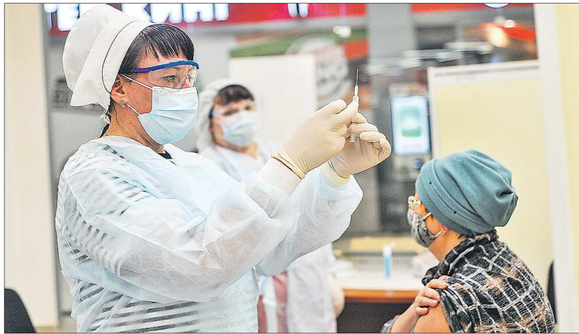
Поставить прививку против гриппа в этом году можно даже в торговом центре