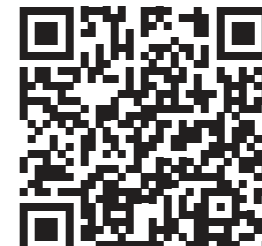
Госпиталь Тетюхина: мы его теряем? (номер от 20.07.2021)

– Да, правда. Нефть у нас есть, даже есть уже несколько лицензионных участков. Компании-интересанты ведут доразведку этих участков. Как только будут понятны объёмы инвестиционных проектов, будут понятны сроки освоения этих месторождений. Я склоняюсь к тому, что мы когда-то будем добывать нефть.