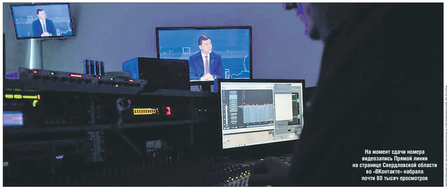
На момент сдачи номера видеозапись Прямой линии на странице Свердловской области во «ВКонтакте» набрала почти 80 тысяч просмотров

В понедельник вечером глава региона Евгений Куйвашев провёл с жителями области Прямую линию – третью в целом и первую на телеканале ОТВ – подобную той, что ежегодно проводит Президент России Владимир Путин. За два с половиной часа губернатор успел ответить на 42 вопроса, 11 из которых оказались анонимными. Практически к каждому вопросу спикер оказывался готов: говорил, что знаком с ситуацией, давал поручения профильным министрам или главам территорий. По всей видимости, во время поездок по муниципалитетам, которых за последнее время было достаточно много, об этих проблемах главе региона уже сообщали.