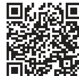
Как на самом деле тушат пожары в лесах Свердловской области? (номер от 26.08.2021)

Людей больше интересует, как мы будем тушить эти пожары. Все пожары обслуживались, были локализованы. Над некоторыми пришлось пускать встречный пал, чтобы не допустить угрозы жизни людей. СМИ активно освещали работу добровольцев. Я совершенно не против, когда люди с неравнодушием относятся к нашей природе и её защите. Но всё же в этом деле нужно доверять профессионалам, которые обучены тушению пожаров. Наши пожарные – настоящие герои.