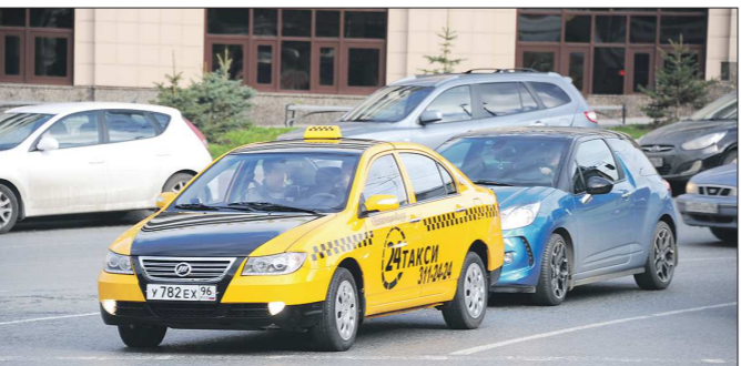
Отсрочка в прохождении техосмотра не касается такси

В конце февраля председатель Правительства РФ Михаил Мишустин подписал постановление, согласно которому до 1 октября 2021 года продлевается срок действия диагностических карт, период действия которых истекает с 1 февраля по 30 сентября этого года. По сути, это отодвинуло на осень начало масштабной реформы техосмотра, которая должна была стартовать 1 марта 2021 года. Напомним, что введение автоматизированной системы техосмотра ЕАИСТО обяжет операторов, проводящих технический осмотр автомобилей, подтверждать это фотофиксацией и оформлять диагностические карты в электронном виде с цифровой подписью. Нововведение задумывалось, чтобы покончить с формальным подходом к этой про-