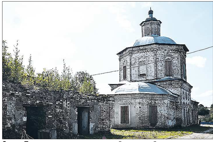
Старо-Покровская церковь – первый каменный храм в Верхотурском женском монастыре