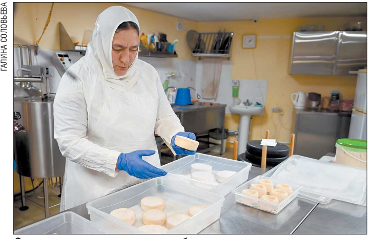
Сыр в монастыре делают из собственного молока и продают прихожанам