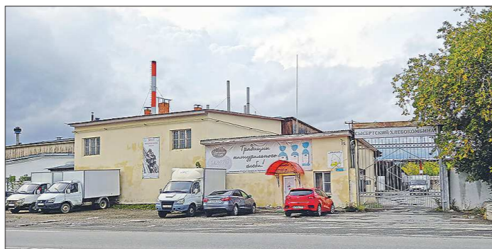
Помещения прекратившего работу хлебокомбината будут выкуплены или сданы в аренду

Получить комментарии руководства предприятия «Областной газете» не удалось – начиная с 1 сентября вплоть до момента сдачи номера в печать телефоны хлебокомбината не отвечали. Однако на днях в СМИ появилось письмо, которое управляющий заводом