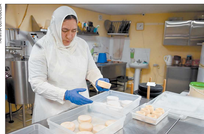
Сыры в монастыре делают из собственного молока и продают прихожанам