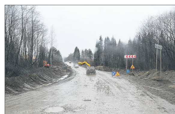
Сейчас дорога Гари – Таборы не соответствует нормативным требованиям

ли «Областной газете» в управлении автомобильных дорог Свердловской области.