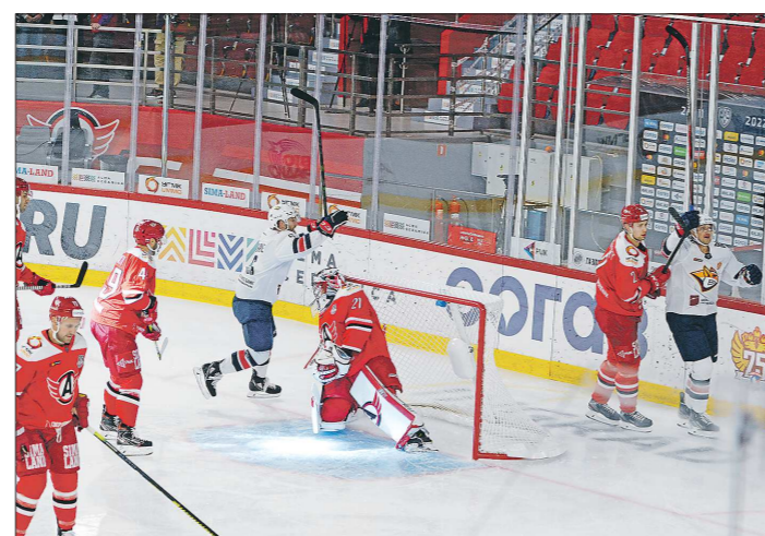
В первом матче нового сезона «Автомобилист» пропустил шесть шайб от магнитогорского «Металлурга»

От проблем не избавились екатеринбуржцы и в обороне. Крайне легко давали «шоферы» в первых двух встречах создавать моменты у своих ворот, значительно уступали соперникам по заблокированным броскам, хотя в предыдущих сезонах «Автомобилист» был одним из лучших по этому показателю. Индивидуальные