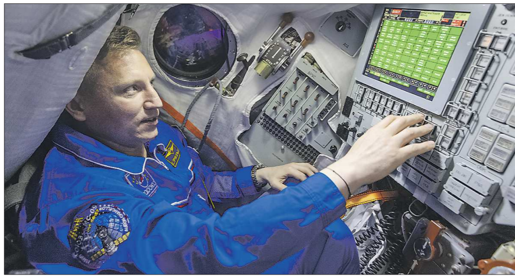
Сергей Прокопьев будет на орбите в год 300-летия Екатеринбурга. Чтобы записать поздравительный ролик к юбилею родного города, он возьмёт на МКС символику уральской столицы