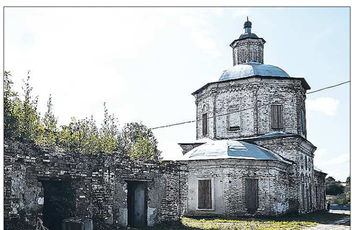
Старо-Покровская церковь – первый каменный храм в Верхотурском женском монастыре