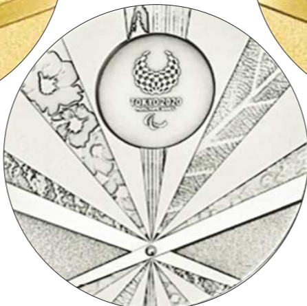
Сборная по волейболу сидя