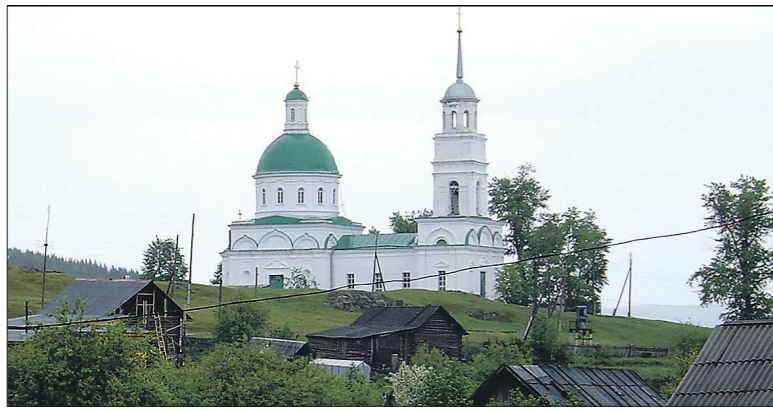
Храм во имя святых Петра и Павла – главное украшение Черноисточинска