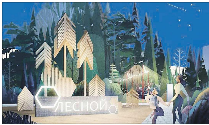
Лесной впервые участвовал в конкурсе и победил