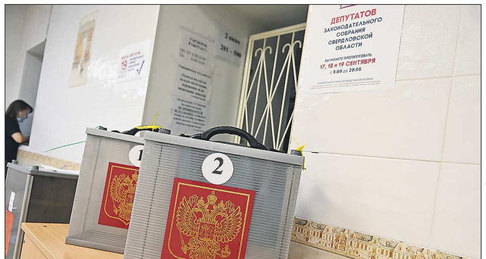
Помимо двух спортсменов, из списков кандидатов на выборы в Заксобрание исключены ещё 4 кандидата

Подготовлено в соответствии с критериями, утверждёнными приказом Департамента информационной политики Свердловской области от 09.01.2018 №1