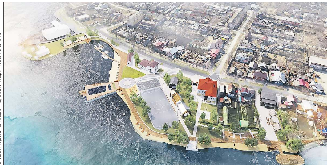
Так будет через год выглядеть набережная Невьянского пруда

Набережная соединяет главные туристические объекты исторического центра города: наклонную башню, Спасо-Преображенский собор, дом купца Дождева, где работает Школа маленького иконописца.