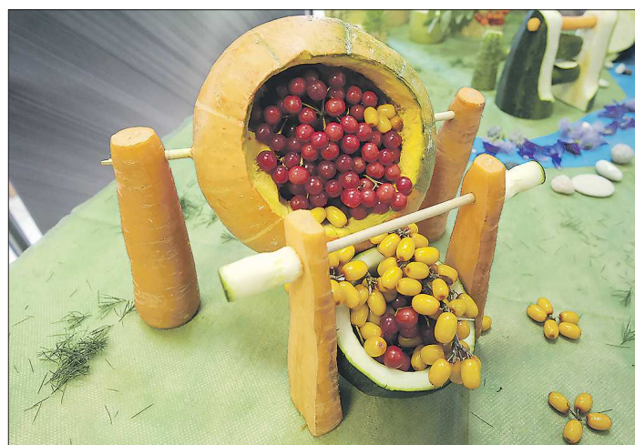
В этой работе мартеновский ковш сделан из тыквы, а расплавленный металл имитирует россыпь ягод

несколько тысяч человек со всей области. Массовость проекта сви-