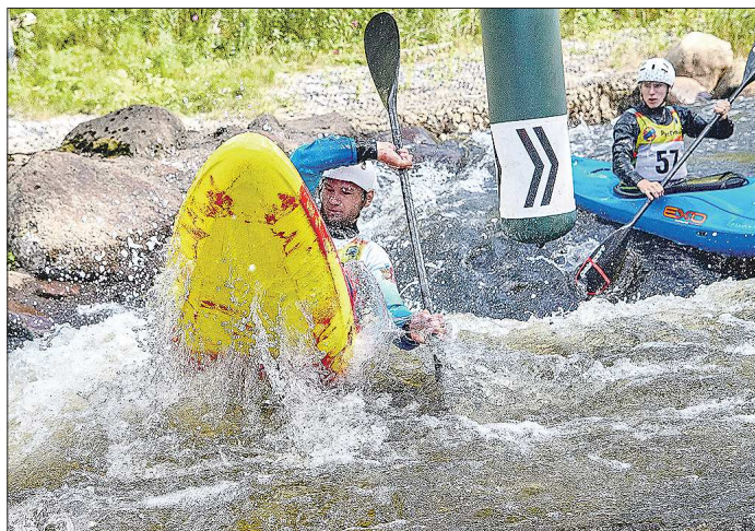
Для соревнований и тренировок слаломистов нужны специальные условия. Любая «гладкая» вода им не подойдёт

Надо понимать, что слаломистам, в отличие от предста-