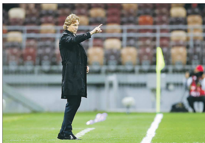
Почти весь матч Валерий Карпин провёл у бровки и активно подсказывал своим футболистам

Сборная России по футболу провела первый матч под руководством нового главного тренера Валерия Карпина . В рамках отборочного турнира к ЧМ-2022 наши футболисты сыграли вничью с Хорватией – 0:0.