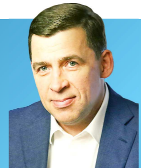
ДЕПАРТАМЕНТ ИНФОРМАЦИОННОЙ ПОЛИТИКИ

будет транслироваться в эфире Областного телевидения и vk.com/svo196