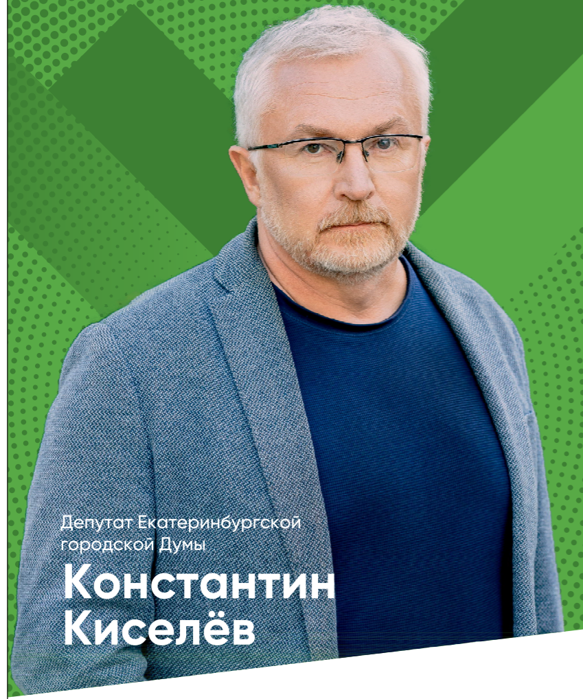
Депутат Екатеринбургской городской Думы