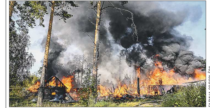
В посёле Исток на площади 150 квадратных метров сгорели сараи (на фото). Возгорание произошло в переулке Молочный.

«На площади 150 квадратных метров сгорели сараи. Пожар локализован, ликвидирован. На месте работали 15 человек личного состава, четыре единицы техники», – рассказали в пресс-службе МЧС корреспонденту «Областной газеты». Спасатели уточнили, что потерпевших нет.