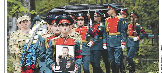
Рота почётного караула несёт портрет, награды и гроб с телом Романа Шадрина

1 сентября в Екатеринбурге состоялась траурная церемония, отпевание и похороны генерал-майора запаса, кавалера ордена Мужества, Героя России Романа Шадрина , который скончался на 55-м году жизни.