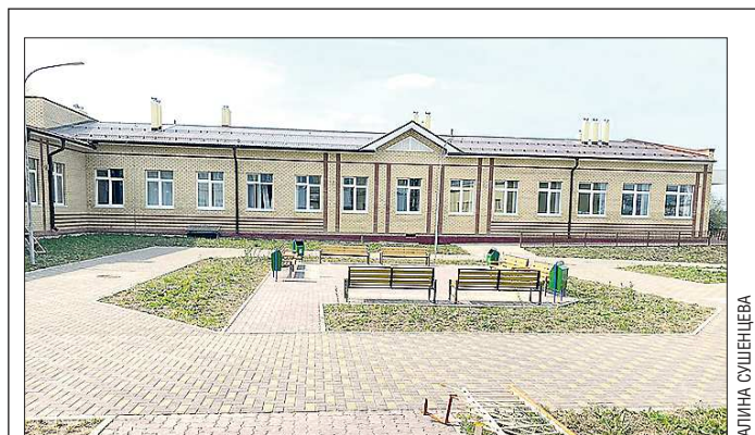
Второй корпус решил сразу несколько проблем в школе Починка

Подготовлено в соответствии с критериями, утвержденными приказом Департамента информационной политики Свердловской области от 09.01.2018 №1