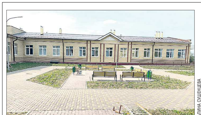
Второй корпус решил сразу несколько проблем в школе Починка

Подготовлено в соответствии с критериями, утвержденными приказом Департамента информационной политики Свердловской области от 09.01.2018 №1.