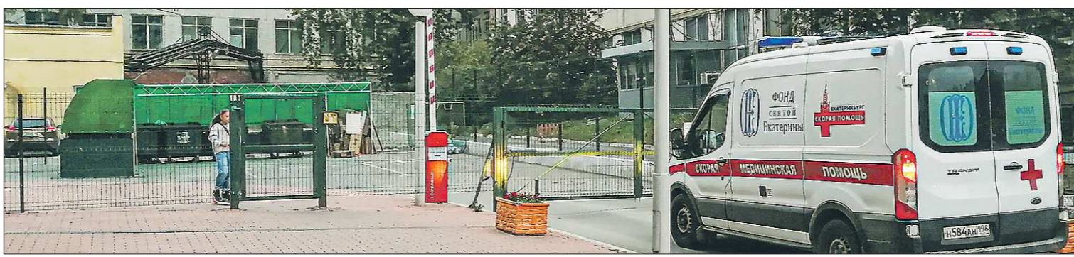
Сейчас для того чтобы водителю скорой помощи мог попасть в закрытый двор, ему приходится звонить охраннику. По существующим требованиям, его номер телефона должен быть размещён на воротах

Всё чаще жители уральской столицы отгораживаются от остального города забором... Раздражённые соседи, которым постоянно приходится обходить закрытые дворы гадают: когда уже нагрянут надзорные органы и ненавидистые ограждения демонтируют?