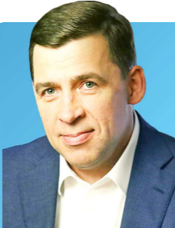
ДЕПАРТАМЕНТ ИНФОРМАЦИОННОЙ ПОЛИТИКИ

будет транслироваться в эфире Областного телевидения и vk.com/svo196