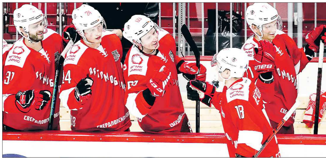
На заключительном этапе подготовки к сезону «Автомобилист» выиграл турнир в Челябинске