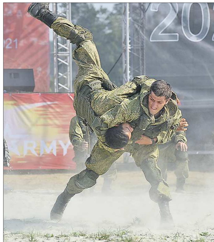
Дни работы форума были насыщены учебными боями