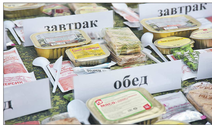
Посетители приезжали на полигон семьями и проводили там по несколько часов, рассматривая экспонаты и наблюдая за показательными выступлениями. На площадке были развёрнуты полевые кухни, в которых гостей угощали вкусной солдатской кашей и работали киоски «Военторга» с сувенирной продукцией