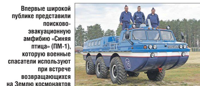
Впервые широкой публике представили поисково-эвакуационную амфибию «Синяя птица» (ПМ-1), которую военные спасатели используют при встрече возвращающихся на Землю космонавтов