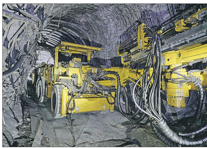
Такая самоходная техника работает на многих крупных шахтах России. Скоро она начнёт проходить и в Нижнем Тагиле

В последнее воскресенье августа в России и многих сопредельных странах отмечается День шахтёра. Дата взята не с потолка: на 31 августа 1935 года донецкий забойщик Алексей Станов установил рекорд, выдав на-гора 102 тонны угля при 7-тонной норме. Накануне профессионального праздника узнаем, как работают современные проходчики «Естонинской» – самой молодой нижнетагильской шахты.