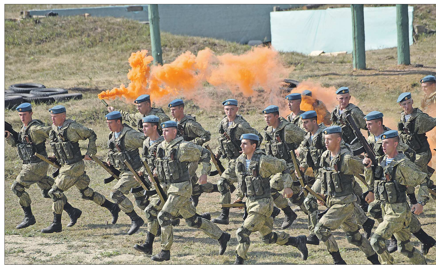
Сегодня в Екатеринбурге завершается международный форум «Армия-2021». На нём было представлено более 150 образцов техники. А одной из самых зрелищных частей форума стали показательные выступления бойцов ВДВ

Военнослужащие ЦВО на форуме «Армия-2021» продемонстрировали потенциал российских войск