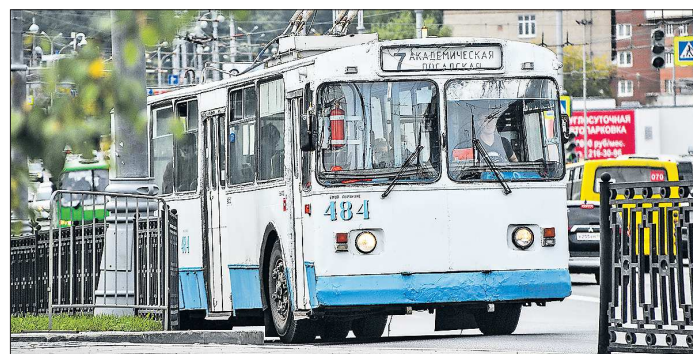
Энергетики пока не грозят городу новыми отключениями трамвайных или троллейбусных депо от электричества, рассчитывая на конструктивный диалог с мэрией

Подготовлено в соответствии с критериями, утверждёнными приказом Департамента информационной политики Свердловской области от 09.01.2018 №1 «Об утверждении критериев отнесения информационных материалов, публикуемых государственными учреждениями Свердловской области, в отношении которых функции и полномочия учредителя осуществляет Департамент информационной политики Свердловской области, к социально значимой информации».