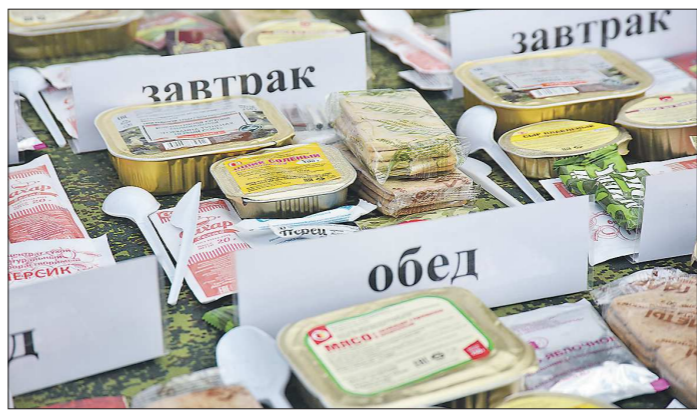
Посетители приезжали на полигон семьями и проводили там по несколько часов, рассматривая экспонаты и наблюдая за показательными выступлениями. На площадке были развёрнуты полевые кухни, в которых гостей угощали вкусной солдатской кашей и работали киоски «Военторга» с сувенирной продукцией