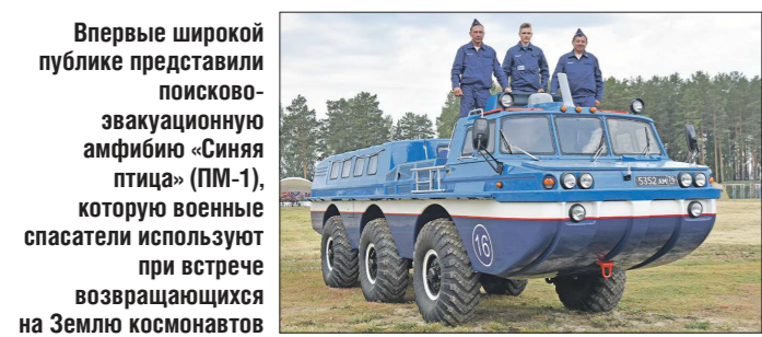
Впервые широкой публике представили поисково-эвакуационную амфибию «Синяя птица» (ПМ-1), которую военные спасатели используют при встрече возвращающихся на Землю космонавтов