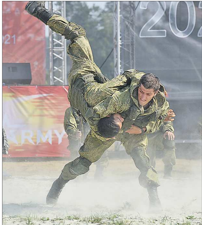
Дни работы форума были насыщены учебными боями