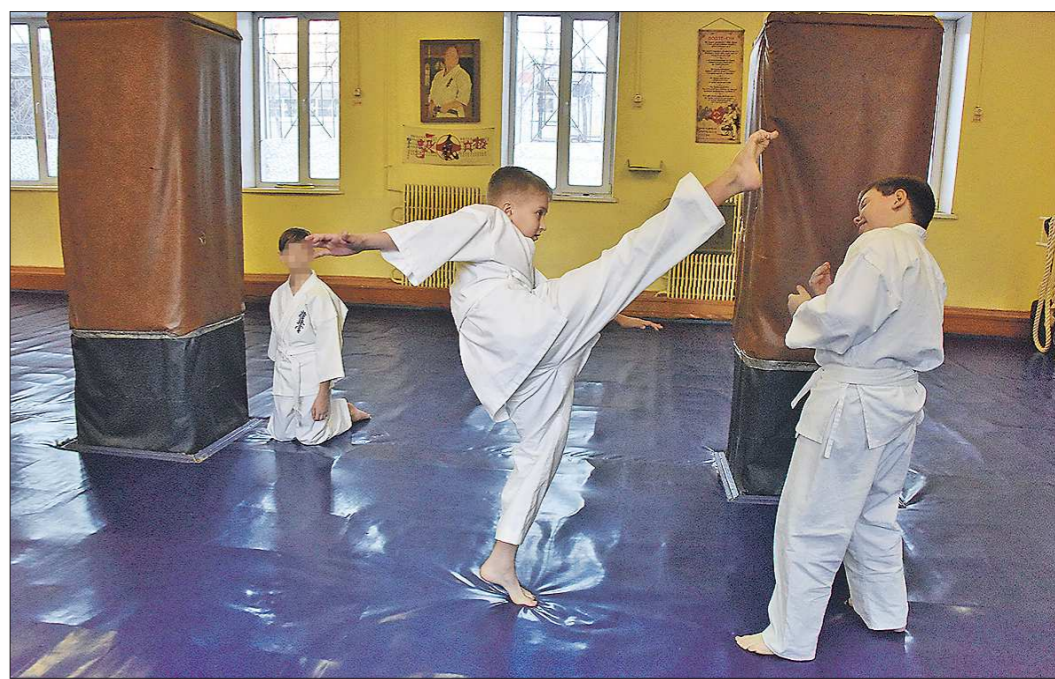
Популярностью у екатеринбургских детей пользуются разные направления дополнительного образования, в том числе спортивные – например карате

Запись в бесплатные кружки и секции уральской столицы продлится до 10 сентября 2021 года. Не успевшие подать заявление, как сообщили «Облазет» в департаменте образования Екатеринбурга, могут записать своего ребёнка на бесплатные занятия и позже, по сути – в течение всего года. Но только при наличии свободных мест, а вот будут ли они – большой вопрос. Всего к новому учебному году власти Екатеринбурга подготовили 13 503 места для бесплатного обучения детей по дополнительным общеобразовательным программам –