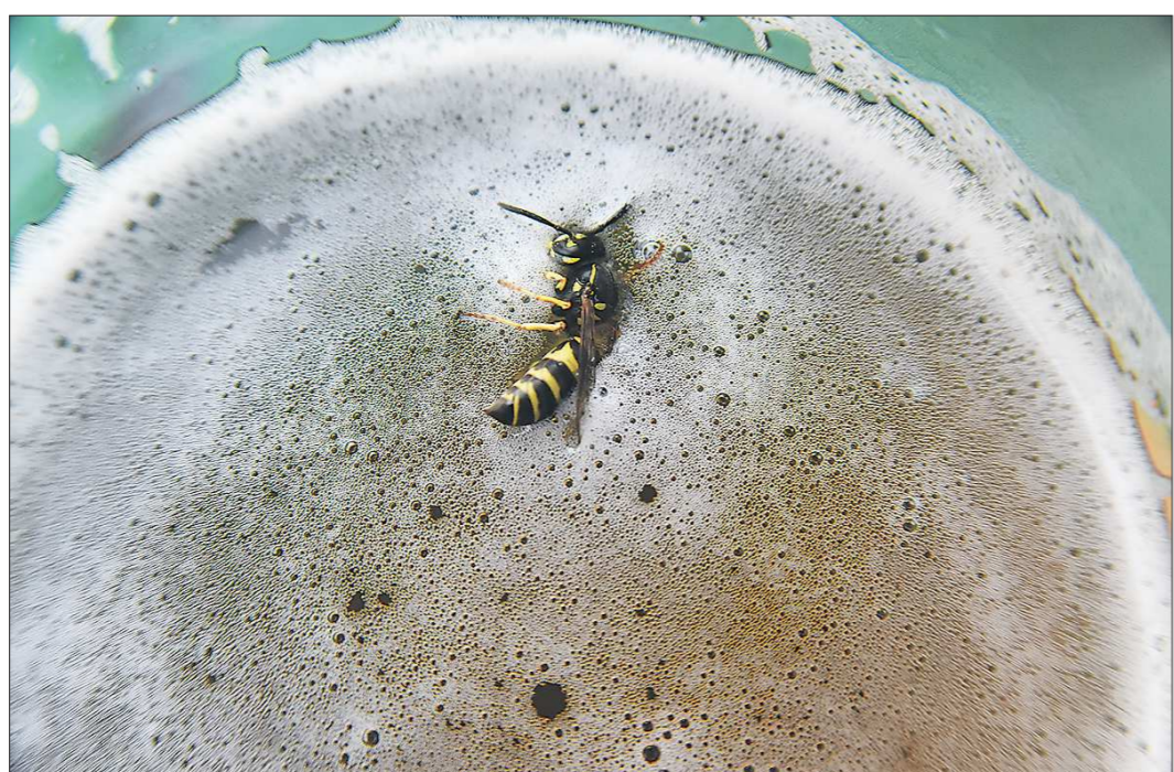
Стремление к сладенькому у ос иногда до добра не доводит

Екатеринбуржцы жалуются на нашествие ос. Насекомых замечают в садах, на дачах, озерах и даже в центре города. Беспокойство, а то и панику осы, конечно, вызывают, но специалисты уверяют, что активность этих насекомых будет недолгой.