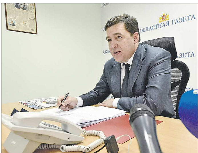
Первые две прямые линии действующего губернатора прошли на площадке «ОГ». В этом году она состоится на ОТВ