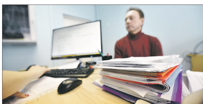
Лидерами по числу проверок свердловского бизнеса стали восемь контрольно-надзорных органов, в том числе Роспотребнадзор, Роструд и МЧС

Несмотря на снижение числа контрольно-надзорных мероприятий, предприниматели говорят, что за последний год административная нагрузка на их бизнес, наоборот, увеличилась (так ответили 41,9 процента опрошенных бизнесменов)