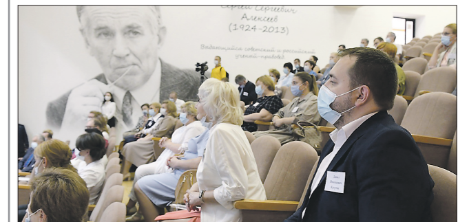
Традиционный августовский педсовет прошёл в этом году на площадке регионального центра для одарённых детей «Золотое сечение»

С такой инициативой выступил глава региона. Раньше свердловские педагоги могли получить это звание только на федеральном уровне.