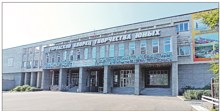
Во Дворце творчества юных занимаются 4,5 тысячи детей из всех районов Нижнего Тагила

— После обновления у нас будет тепло, безопасно, красиво. Планируется утепление фасада, замена сетей, в том числе электрических, ко-